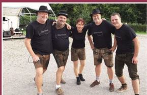
Sonntag, 3. September SCHORLEXAID