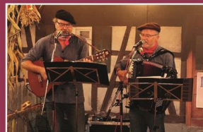
Sonntag, 17. September Hons un Fronz