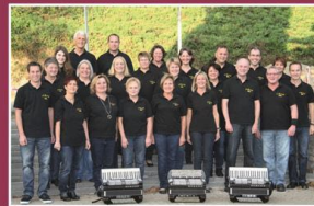
Sonntag, 20. August Harmonikafreunde Lauf e.V.