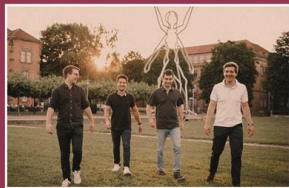
Sonntag, 13. August HIPSHAKER