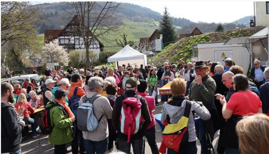
Eröffnung Wander-Opening im Michelbach

Hier ein paar Impressionen vom Wander-Opening: