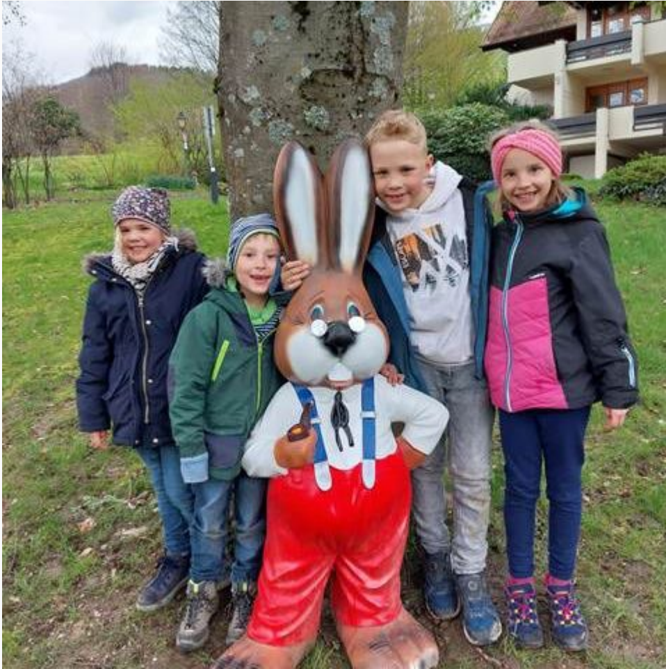
Spaß bei der Osterhasen-Rallye mit unserem „Sunny“ vor dem Kurhaus.

Informationen für unsere Leistungsträger